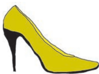
C-752 „High Heel“ Oft reicht das bloße Erscheinen der C-752 auf dem Schlachtfeld, dass sich ganze Kompanien neoliberaler Politiker ergeben. Ihr Einsatz kann sehr schmerzhaft sein.