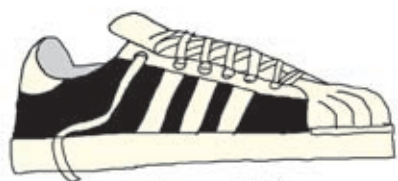
CRG-109 „Superstar“ Kann aus geringer Nähe abgeworfen werden. Kann bis 2m dicke Holzköpfe zum Denken anregen.