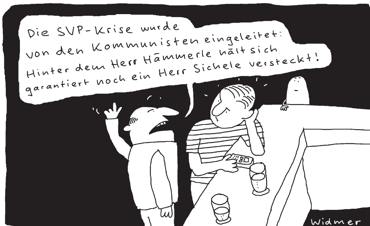
ILLUSTRATION: RUEDI WIDMER, ERSCHIENEN IN DER WOZ NR. 26/08