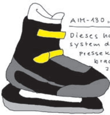
AH-130 „Ice Storm“ Dieses hartschalige Schuhsystem darf nicht in alle Pressekonferenzen mitgebracht werden. Selbst Journalisten fürchten sich vor seinem Einsatz.