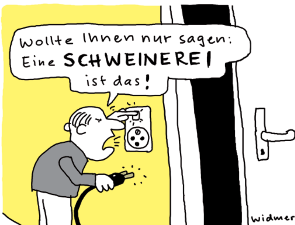
ILLUSTRATION: RUEDI WIDMER, ERSCHIENEN IN DER WOZ NR. 38/08

Alle Artikel sind gratis unter www.prowoz.ch abrufbar.