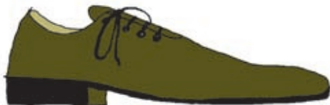
B-88 „Halbschuh“ Einfach und robust aufgebaut, können diese Schuhe gegen die gleichnamigen Ziele eingesetzt werden.