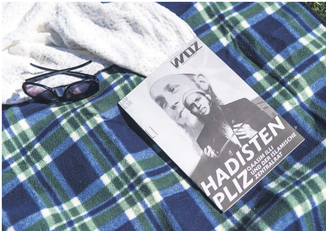
Hadistenpliz? Nein, «Die Dschihadisten von Bümpliz»! Daniel Rysers preisgekrönte Riesenreportage wurde vom Förderverein ProWOZ unterstützt.