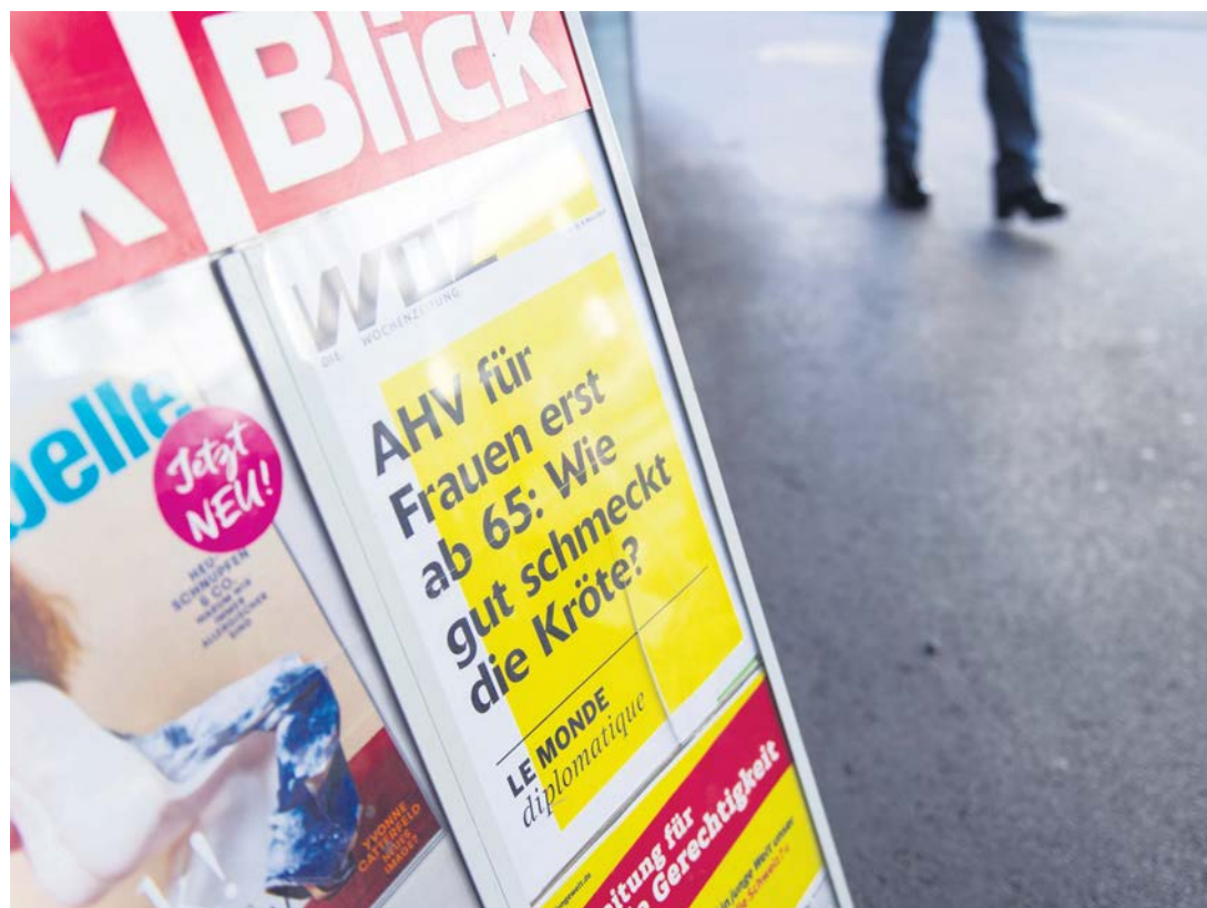
Noch immer ohne Kochrezepte: WOZ-Plakat in Zürich.