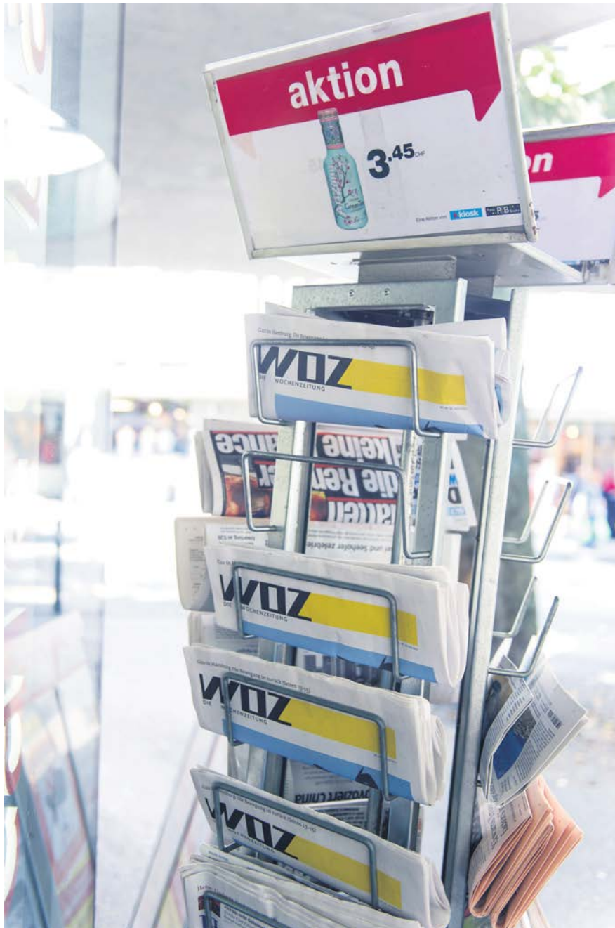
Von der Lektüre zur Aktion: Die WOZ an einem Zürcher Kiosk.